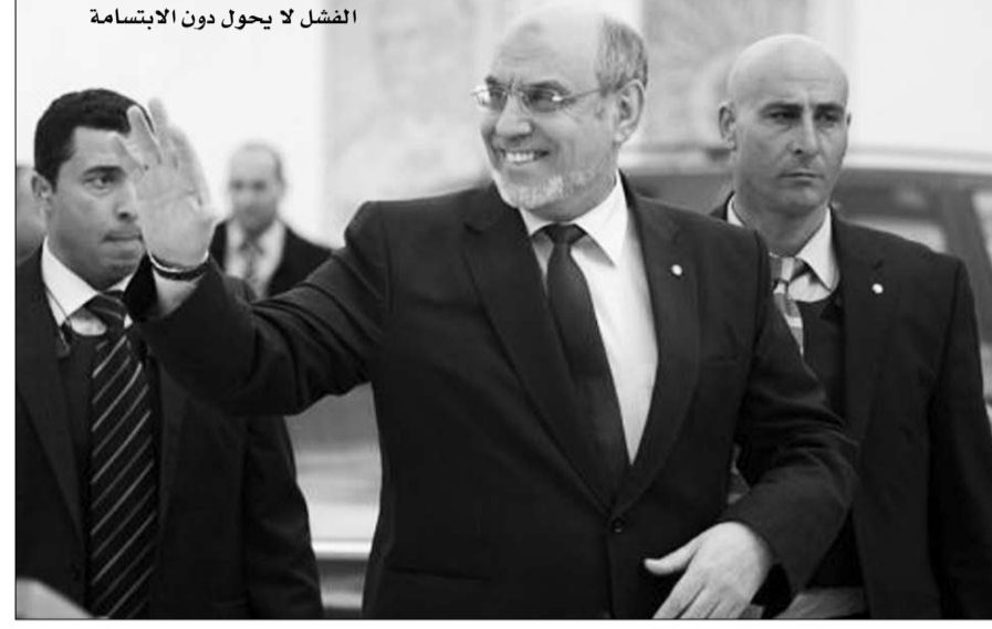
الفشل لا يحول دون الابتساما

فقد طرح حزب حركة النهضة، أبرز رافض لهذه المبادرة حلاً آخر تعديلي جاء على لسان رئيس الحركة راشد الغنوشي الذي صرح ، أنّ هناك توجها نحو حلّ تعديلي لمبادرة رئيس الحكومة المؤقتة حمادي الجبالي يتمثل في تشكيل حكومة كفاءات سياسية مستقلة. وأوضح الغنوشي، في تصريح إداي، أنّ هذه الحكومة السياسية ستكون مستقلة بالأساس لأنها ستتمثل خيارات الدولة وليس خياراتها التي تنتهي إليها، مؤكداً أنّ أعضاء لها يترشحوا إلى الانتخابات المقبلة. وفي هذه الحالة، من المتوقع أنّ تستغرق المفاوضات الجديدة وقتا طويلا لتكون شكل حكومي أخر، وهو أمر من شأنه، حسب بعض المحللين، أنّ يطيل أمد الأزمة السياسية التي تهرج البلاد. ولكنّ تصريحات نسبت أمس إلى محمد بنور الناطق الرسمي باسم حزب التكتل من أجل العمل والحريات، تشير، إذا ما صحّ مضمونها، إلى إمكانية تقليص آجال التفاوض حول تشكيل الحكومة الجديدة بما أن ما أفاد