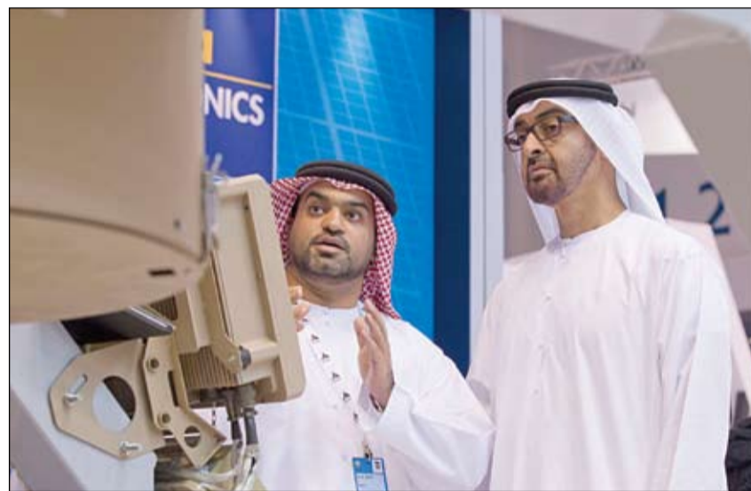
محمد بن زايد خلال تفقده أحد أجنحة معرض آيدكس 2013

وزار سمو ولي عهد أبوظبي عددا من أجنحة الشركات الوطنية والدولية المشاركة في الدورة الحادية عشرة لمعرض آيدكس 2013 والتي يبلغ عددها 1112 شركة تمثل 59 دولة من مختلف دول العالم.