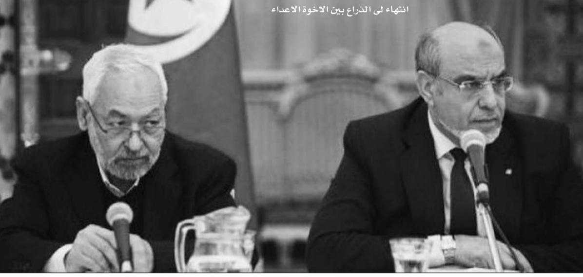
انتهاء لي النزاع بين الاخوة الاعداء

رئيس الحكومة حمادي الجبالي ستحظى بوافق كبير داخل المجلس الوطني التأسيسي. وقال كريشان في تصريح اذاعي إنه تم التوصل إلى مبادرة معدلة تتطلب الوفاق بين جميع الأطراف بعد أن وضعت مبادرة الجبالي جانباً. ويبدو انه، في صورة القبول بهذه الصيغة المعدلة، قد تم الاتفاق على أن تكون الخطوات التشريعية القادمة أوسع من التي جرت في الأيام الأخيرة وتستعمل اتحاد الشغل واتحاد أرباب العمل وعديد مكونات المجتمع المدني والسياسي.