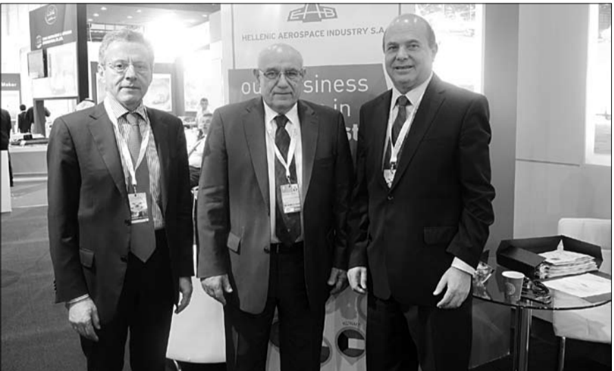
16 تعمل في القواعد الأمريكية في القارة الأوروبية. وإشار إلى أن العقد تضمن التحديث والتطوير برنامج يسمي - سي سي بي.

وتقع منشآت كراكال للذخائر الخفيفة التصنيعية في مجمع توازن الصناعي الواقع في منطقة العجبان بين أبوظبي ودبي. وتعد سينشوري أرمز أكبر مستورد للأسلحة النارية والذخائر والاكسسوارات في أمريكا الشمالية... وقامت الشركة بتلبية احتياجات الصيادين وهواة اقتناء قطع السلاح النادرة والرماة لأكثر من 50 عاما. وتحظى سينشوري أرمز بخبرة في التعامل المباشر مع تجار التجزئة وتجار الجملة للسلع الرياضية في جميع أنحاء العالم من خلال شبكة توزيع كبيرة.. وتعمل الشركة أيضا في مجال الأسلحة النارية حديثة التصنيع والسكاكين والسيوف والذخيرة وأكسسواراتها.