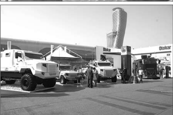
أرييس تكشف النقاب عن أربع سيارات أمنية مدرعة خلال أيدكس 2013