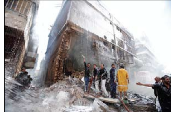
رجال الانقاذ يخمدون الحريق الناتج عن سقوط الطائرة في حي سكني

على الارض. سياسيا أعلن نائب وزير الخارجية الروسي غينادي غاتيلوف أمس ان وزير الخارجية السوري وليد المعلم سيزور موسكو في 25 شباط فبراير. وقال خلال مؤتمر صحافي تنتظر زيارة وزير الخارجية السوري الى موسكو في 25 شباط فبراير موضحا ان المحادثات ستتناول النزاع في سوريا والاجراءات الواجب اتخاذها لبدء حوار. واضاف ايضا انذاك ان رئيس الائتلاف الوطني المعارض احمد معاذ الخطيب سيزور ايضا قريبا العاصمة الروسية. في الوقت ذاته سترسل روسيا اربع سفن حربية اضافية الى المتوسط على ما أعلنت وزارة الدفاع الروسية في ظل تفاقم الأزمة في سوريا، كما انها ستخذ اجراءات من اجل إجلاء رعاياها من البلاد.