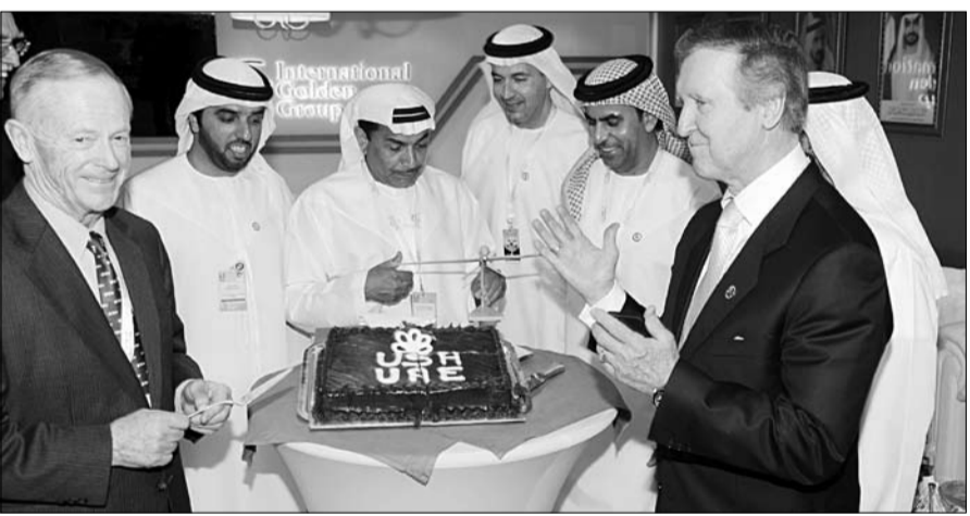
من أشهر الشركات في هذا المجال. وجرى توقيع اتفاقية تعاون مع شركة تكستر الفرنسية المتخصصة الدفاعية للمعدات الدفاعية العسكرية والذخائر وذلك لتوزيع منتجات الشركة في دولة الإمارات العربية المتحدة.

منه. وأضافت أنها تعرض برنامج تطوير المروحيات طراز اوغستا بل 212 التي تمتلكها القوات البحرية الاسبانية.. مشيرة إلى أن البرنامج يشمل تحديث تلك المروحيات لتمديد حياتها العملية لفترة 15 سنة أخرى من طريق تزويدها بمعدات طيرات وأنظمة اتصالات حديثة. يذكر أن مجموعة سينر تأسست عام 1956 وتمتلك خبرة واسعة في عدة مجالات من بينها أنظمة الدفاع البحرية والفضاء وتشارك في صناعة محرك تي بي 400 يوروپروب لطائرة الإيرباص العسكرية وفي إنتاج مرواح وأنظمة أخرى في مقاتلة اليورفايتر.