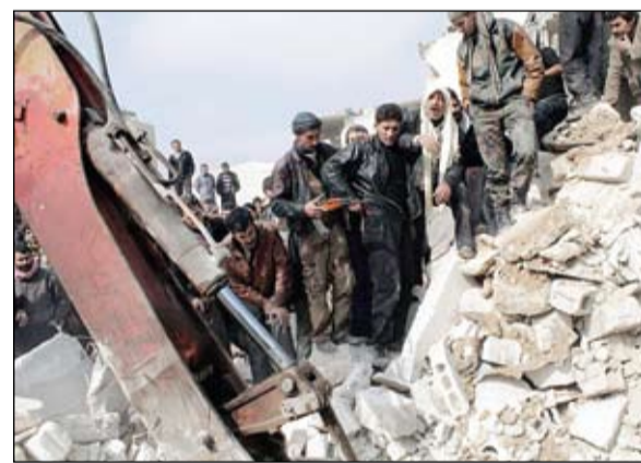
سوريون يشتبهون عن أحياء تحت أنقاض مبنى قصف بغارة على حلب

سقطت قذيفتا هاون أمس بالقرب من قصر تشرين الرئاسة في دمشق وتسببتا بأضرار مادية، بحسب ما ذكرت وكالة الأنباء الرسمية (سانا). ونقلت سانا عن مصدر مسؤول قوله ان القذيفتين سقطتا باتجاه السور الجنوبي لتسفر تشرين واسفرتا عن اضرار مادية فقط. ويوجد ثلاثة قصور رئاسية في دمشق، احدهما هو قصر الشعب المعروف ايضا بقصر المهاجرين وموقعه على جبل قاسيون المطل على قصر تشرين، والثالث هو قصر الروضة الذي توجد فيه المكاتب الرئاسية. في غضون ذلك قال نشطاء من المعارضة السورية أمس ان هجوما صاروخيا شنه الجيش السوري على حي واقف تحت سيطرة